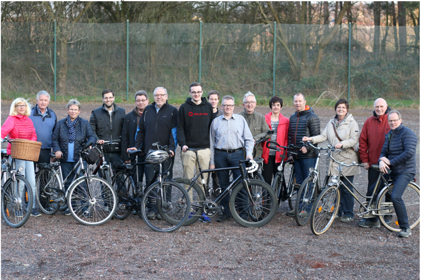
Die CDU-Fraktion auf den ehemaligen Tennisplätzen am Wickeder Freibad

So beschäftigt sich die Wickeder Union seit einiger Zeit intensiv damit, das Thema „Fahrrad und Freizeit“ in der Ruhrgemeinde noch deutlicher auszubauen. Wickede mit seiner Lage im grünen Ruhrtal bietet reichlich Potential, noch öfter überregionales Ausflugsziel für Radtouristen zu sein. Auch eine Aufwertung des Freizeitsportangebotes für die hier lebenden Bürgerinnen und Bürger sei wünschenswert. Nicht zuletzt bestätigte auch die kürzlich durchgeführte Online-Umfrage der Gemeinde, dass für viele Wickeder der Ruhrtalradweg und die Verbundenheit zur Natur einen hohen Stellenwert habe. Letztendlich mache sich das auch im Anstieg des hiesigen Radverkehrs bemerkbar. Dank der E-Bike-Technologie seien insbesondere ältere Mitbürger deutlich länger aktiv.