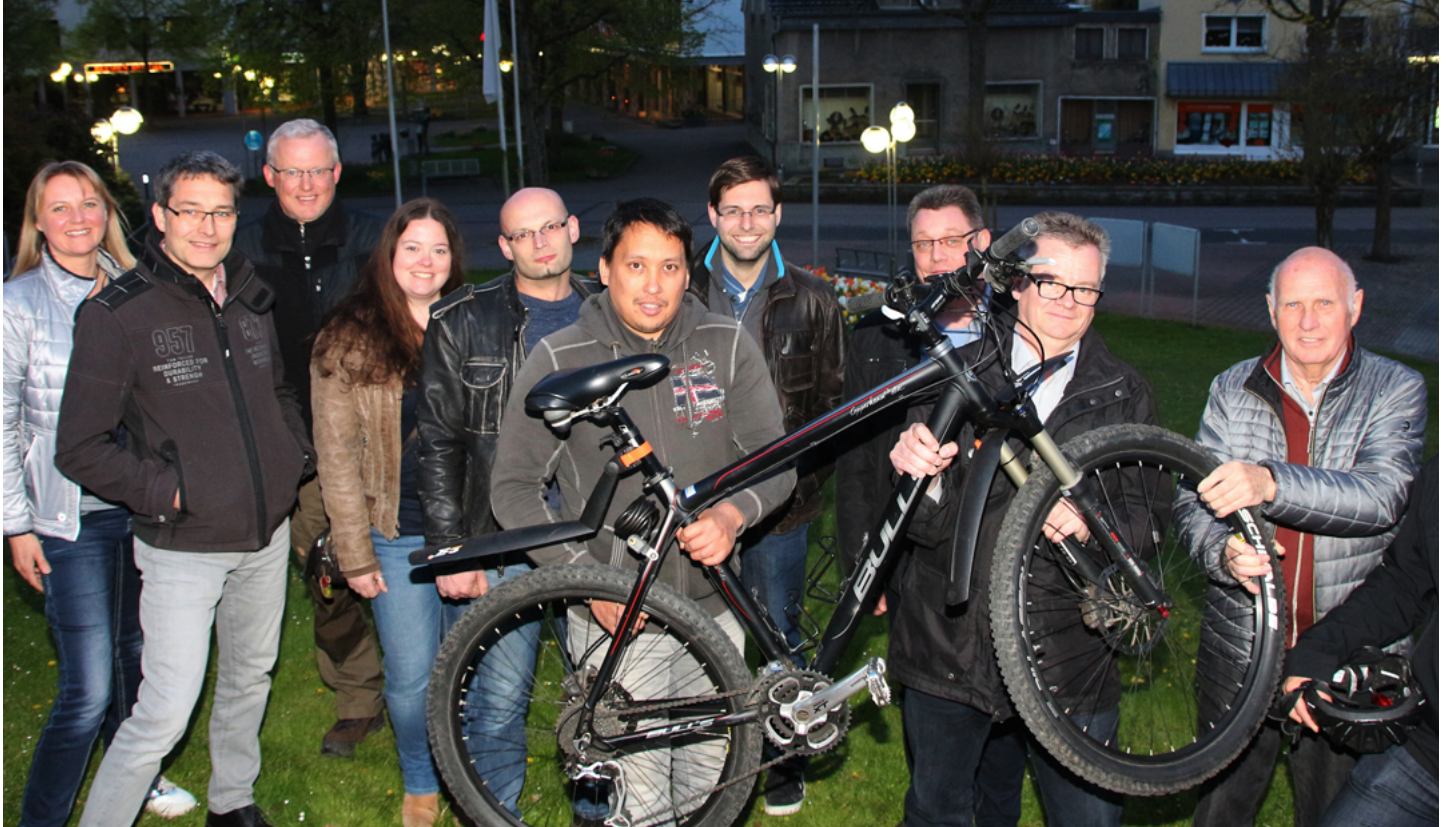
Die Projektgruppe "Zweiradort Wickede (Ruhr)" ist gestartet.

So wäre eine eigene Wickede-App eine Option, die gastronomische oder kulturelle Hinweise sowie innerörtliche Fahrrad- und Wanderrouten aber auch Übernachtung aufzeigen könnte. Denkbar seien auch kleine Übernachtungshäuschen, die gegebenenfalls mit den sanitären Anlagen des Freibades verknüpft werden könnten.